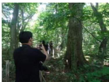
留山トレッキング