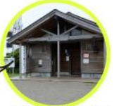
入道崎周地公衆トイレ

店内は一般トイレとなっています。車いすトイレを利用の場合は公衆トイレをご利用下さい。