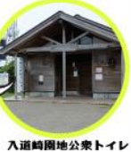
入道崎園地公衆トイレ

店内は一般トイレとなっています。車いすトイレを利用の場合は公衆トイレをご利用下さい。